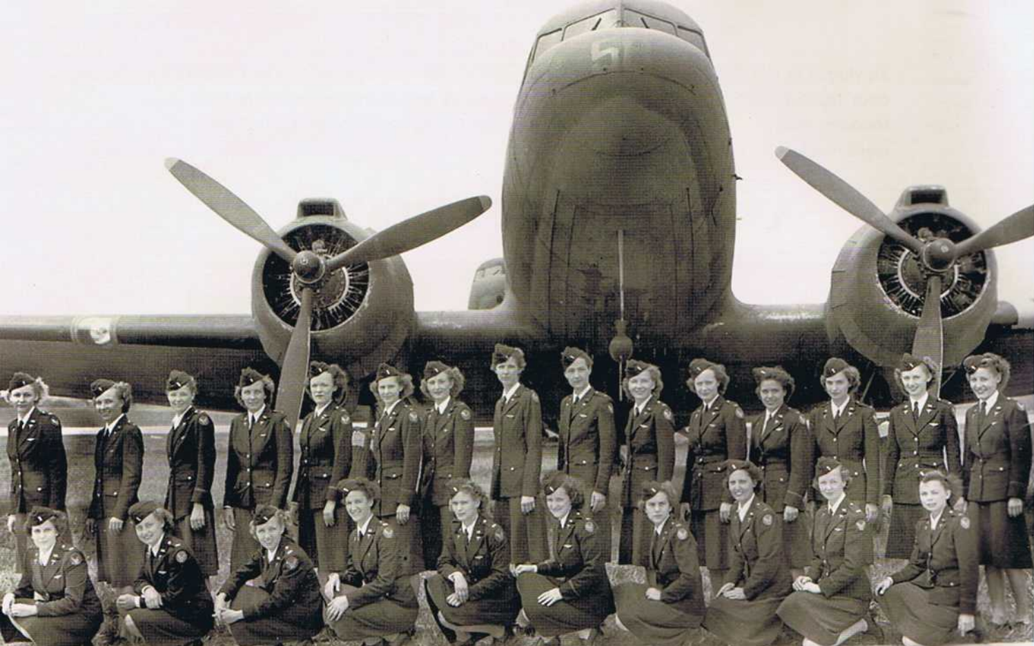
'Staatsieportret' van het 807th Medical Air Evacuation Squadron voor een C-47 op Bowman Field Kentucky in juli 1943.